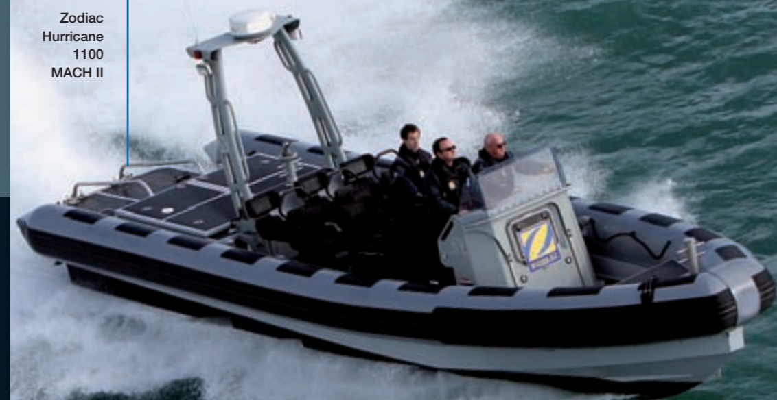
Zodiac Hurracane 1100 MACH II

© ZODIAC INTERNATIONAL® - 11/2009 - www.dep.fr - Photos : droits réservés